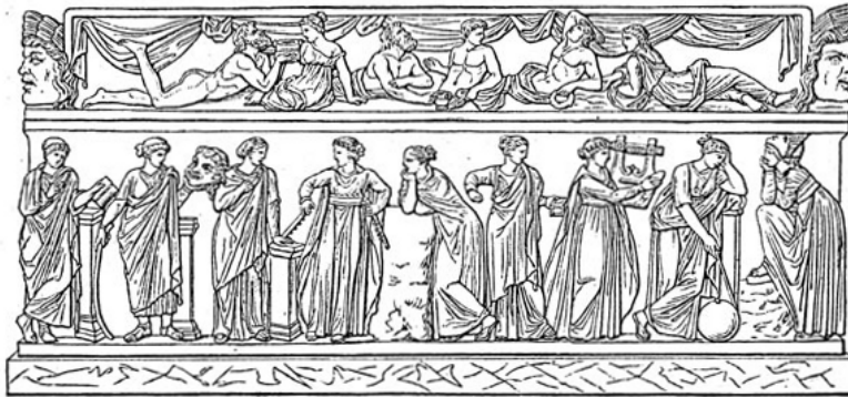
Bederatzi musa kanonikoak (ezkerretik eskubira): Clío, Talía, Erato, Euterpe, Polimnia, Calíope, Terpsícore, Urania eta Melpómene. Louvre Museoko sarkografoaren irudia.

Hilkorren inspiratzaileak bezela sarritan "Arte Ederrekin" nahigabe lotutak.